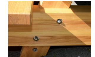
Verbindung des Sitzgestells