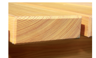
Verarbeitung Sitz- und Rückenlehnen