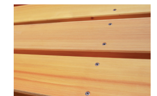
Verschraubungen in Edelstahl