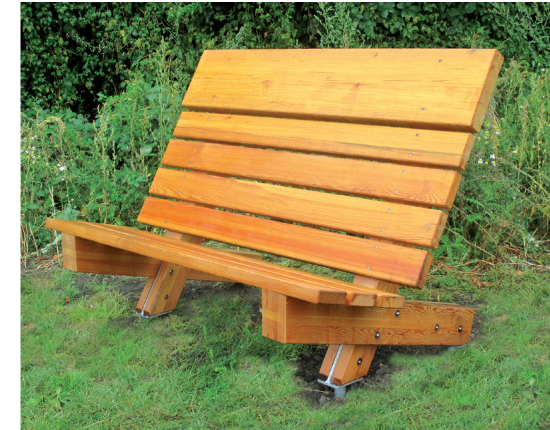
Sonnenanbeterbank in Holzausführung