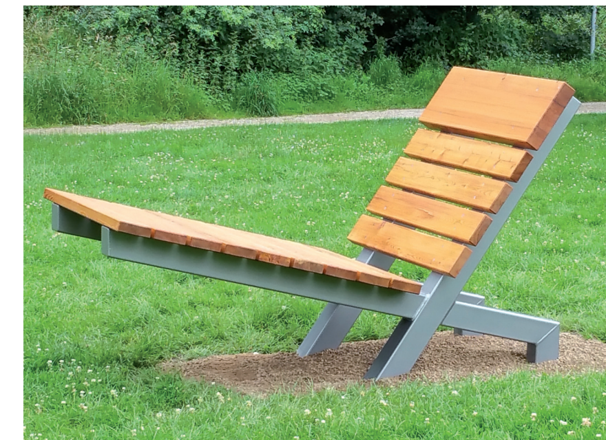
Sternguckerliege mit Stahlgestell