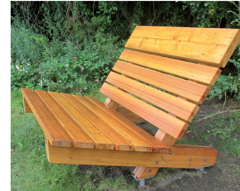
Sternguckerbank in Holzausführung

... die Bank für Alt und Jung mit hoher Lehne und Kopfkissen. Gestell aus verzinktem Stahlprofil, Auflagen aus Lärche-/ Douglasienholzdielen 40 x 120 mm, Höhe 1070 mm, Breite 1500 mm, Sitztiefe 435 mm, Kopfkissen 70 x 280 mm, alle Hölzer gehobelt und gefast.