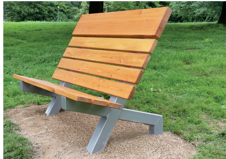
Sonnenanbeterbank mit Stahlgestell