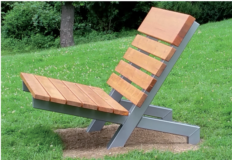
Sternguckerbank mit Stahlgestell

Unsere Bänke liefern wir wahlweise mit Fundamentankern zum Aufschrauben auf Ortfundamente oder auf Fertigfundamente. Auf Wunsch liefern wir Ihnen die Bänke mit verkürztem Anker zum Aufschrauben auf feste Untergründe (Beton oder Asphalt), z.B. Schulhof. Die Bänke werden zerlegt auf Palette geliefert. Sonderformen wie Sechseck oder Quadrat fertigen wir auf Anfrage nach Ihren Vorstellungen. Weitere Fotos unserer Bänke finden Sie unter www.team-th.de