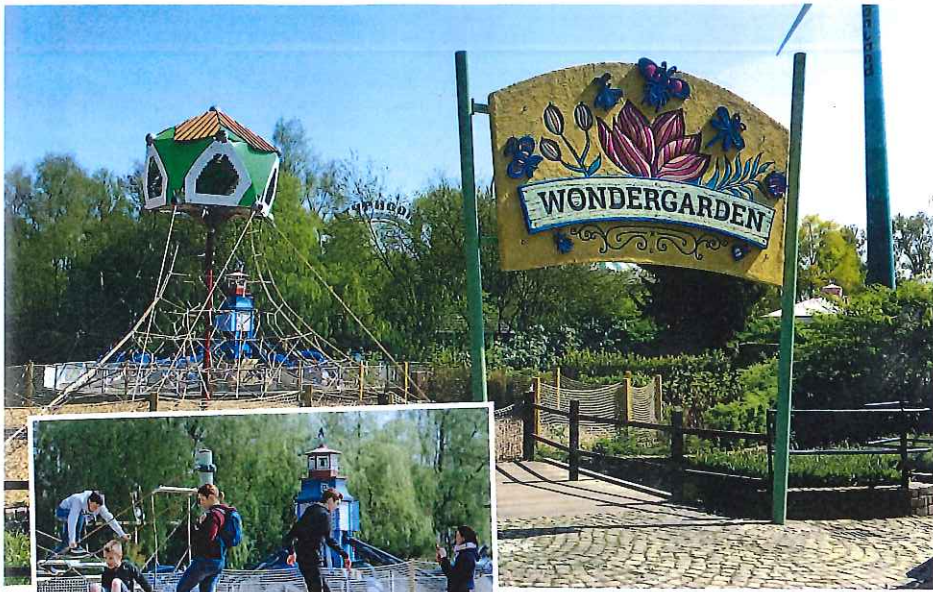
Wie ein großes Vogelhäuschen zieht das hohe Baumhaus die Blicke auf sich und die kleinen Parkgäste auf das neue Spielareal direkt neben der Gastronomie-Terrasse.